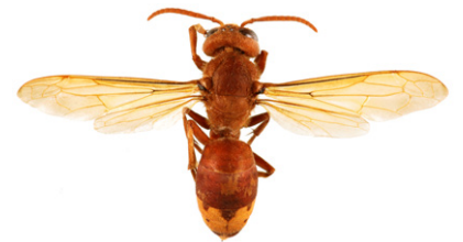
Orientalische Hornisse, Vespa orientalis

Wespen sind kleiner als Hornissen. Arbeiterinnen werden im Spätsommer etwa 15 mm lang. Es ist zu beachten, dass Wespenköniginnen etwas größer als 20 mm werden können, also etwa so groß wie die hier abgebildete Asiatische Hornisse ohne den Kopf. Im Frühling können Wespen daher größer als die ersten geschlüpften Hornissen-Arbeiterinnen sein.