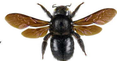
Blaue Holzbiene, Xylocopa violacea

Die Blaue Holzbiene , Xylocopa violacea , ist 20 bis 30 mm lang, vollkommen schwarz gefärbt und schimmert violett-blau. Die Weibchen dieser Solitärbieneart bauen ihre Nester in mürbem Totholz und sammeln Pollen als Nahrung für ihre Brut.